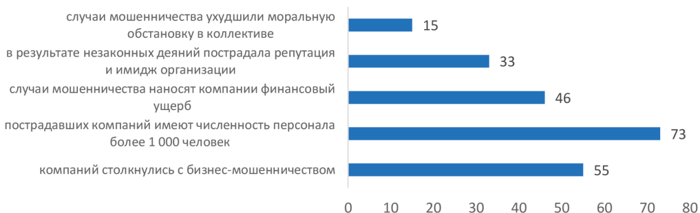
Рис. 2. Результаты исследования аудиторской компании из «большой четверки» Deloitte Forensic