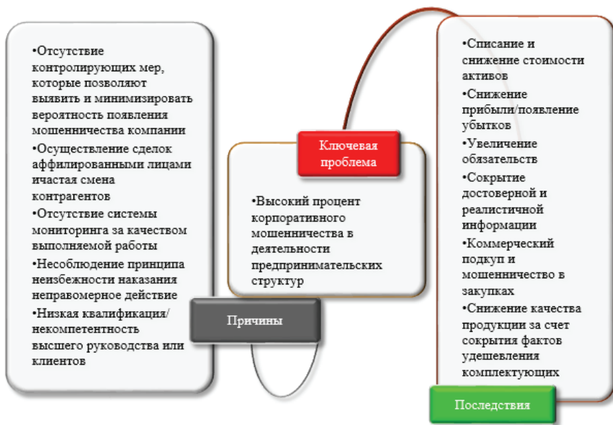
Рис. 1. Дерево проблем

Подтверждение гипотезы H2: В 2022 году Ростелеком Солар провел социологическое исследование, посвященное изучению тенденций корпоративного мошенничества. В опросе приняли участие представители свыше 120 российских организаций из различных сфер деятельности (от e-commerce до атомной промышленности). Размер опрошенных компаний представлен категориями «малый бизнес» (до 100 сотрудников), «средний бизнес» (от 500 до 1000 сотрудников), и «крупный бизнес» (свыше 1000 сотрудников).