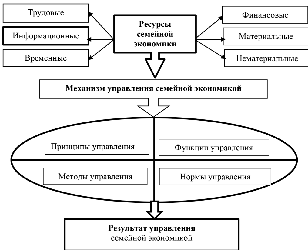
Рис. 2. Модель механизма управления семейной экономикой

Механизм управления семейной экономикой рассматривается в данном исследовании как совокупность инструментов [8, стр. 183-184], направленных на самостоятельное координирование экономической деятельности семьи, являющейся более действенной мерой, чем государственное регулирование. В условиях высокой дифференциации типов поведения семей в управлении своим экономическим развитием механизм управления помогает понять и принять во внимание весь комплекс присущих семье характеристик, а также характер и глубину возникающих отклонений от желаемых параметров жизнедеятельности.